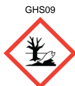
DANGEREUX POUR LE MILIEU AQUATIQUE