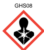
DANGEREUX POUR LA SANTÉ